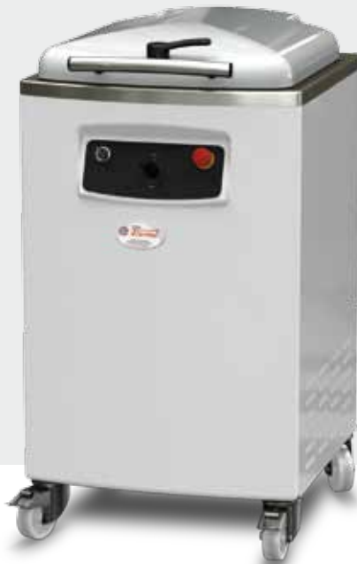
Semi Automatica Semi Automatic Semi Automatique