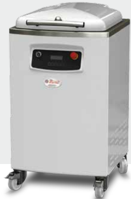
Automatica Automatic Automatique