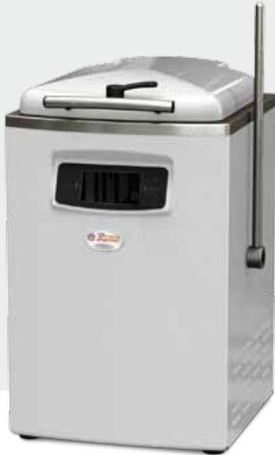
Manuale Manually Manuelle