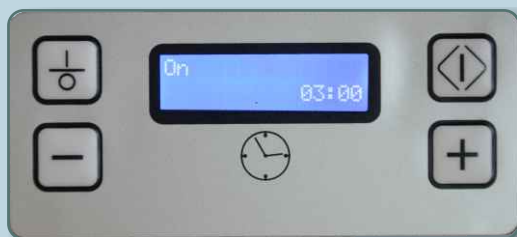
Easy control display Intuitivo pannello di controllo