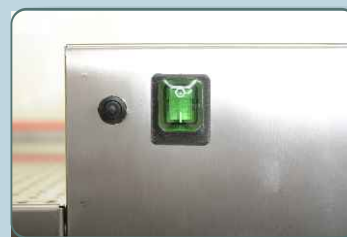
Power button on/off , reset button Pulsante accensione generale ON/OFF, Pulsante reset