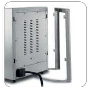
Supporto a muro per mod. Pro Pro models wall support