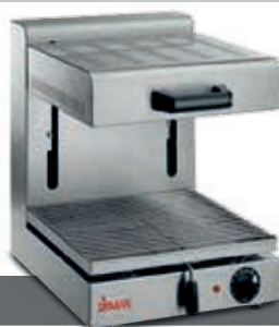
PRO 1/2 G