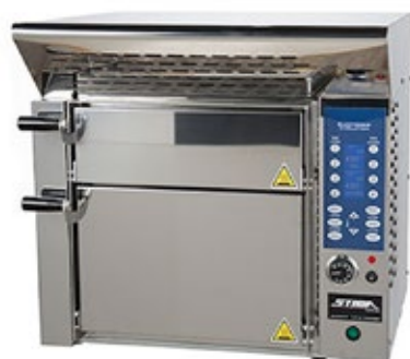
STIMA VP3 Φούρνος πίτσας με 3 ορόφους

Διάσταση (Π x Β x Υ) 660x540x640 Ισχύς kw 4,1