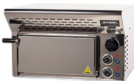
STIMA VP1 Φούρνος πίτσας με έναν όροφο

Διάσταση (Π x Β x Υ) 460x470x595 Ισχύς KW 1,9