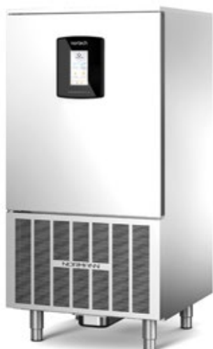
NORMANN NORTECH 10