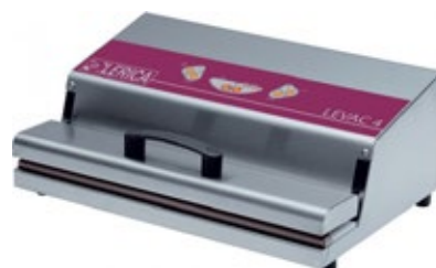
LERICA LEVAC 4