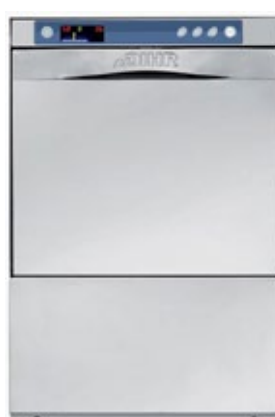
DHR GS 35 T