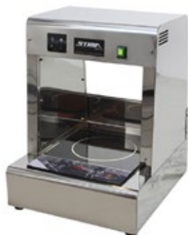
STIMA SPEEDY CHEF Επαγωγική Εστία

Διάσταση (Π x Β x Υ) 460x470x595 Ισχύς KW 1,9