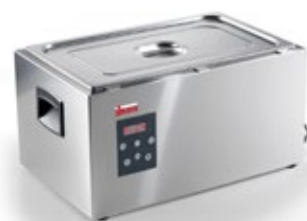
GN 2/3 - GN 1/1

Διάσταση (Π x Β x Υ) 165x203x377 Ισχύς kw 2 Θερμοκρασία 24 - 99