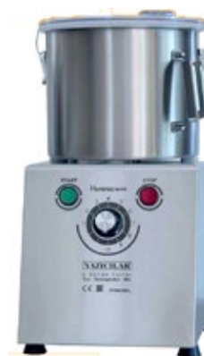
INVERTER YAZICILAR DIV