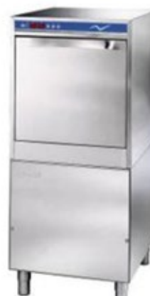
DHR ELECTRON 1000 PLUS