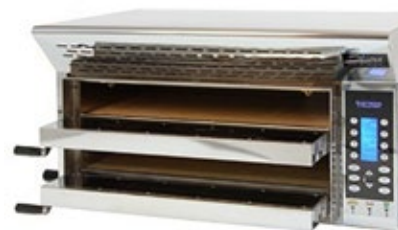
STIMA VP2 XL Φούρνος πίτσας με 2 ορόφους

Διάσταση (Π x Β x Υ) 630x450x410 Ισχύς kw 2