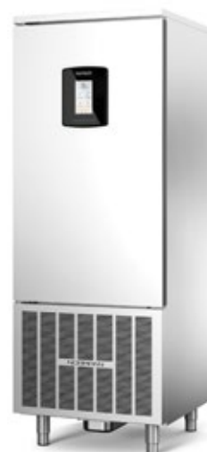
NORMANN NORTECH 15