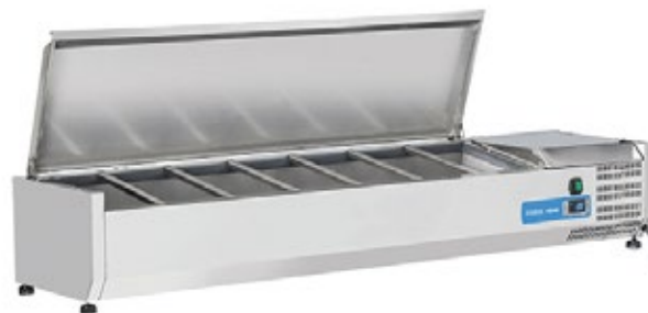
KONTEK VRX 15/33S/S