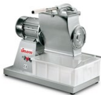
SIRMAN GF HP 4

ΠxΒxΥ mm 280x510x510 ΙΣΧΥΣ W 515 ΤΑΧΥΤΗΤΑ RPM 300