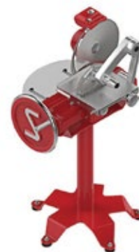
SIRMAN LEGEND 350