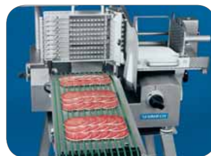
VA 4000 AT